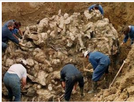
Masovna grobnica u BiH / arhiv

U posljednjih mjesec dana ova vijest se jedva provlačila čak i kroz medije iz Federacije BiH, a mediji iz RS-a i Srbije tek u pet rečenica bez da se kaže jasno i glasno o kome je riječ - ko su žrtve, a ko zločinci. Od jučer je riječ Tomašica preplavila internet, što je velika zasluga stranih medija koje naše novine i portali redovno prevode.