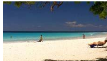
Skulle till Spanien - hamnade i Karibien