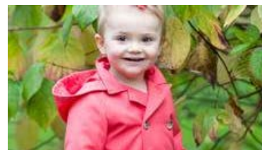
Glad höst önskar Estelle