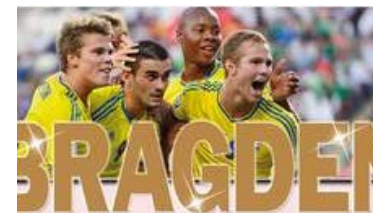
Sveriges nya bronshjältar