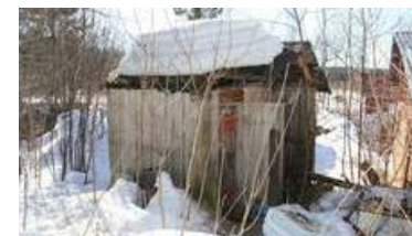
8-åring låstes in i hönshuset