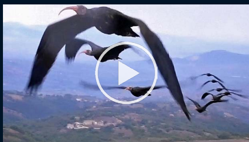
Därför flyger fåglar i v-form