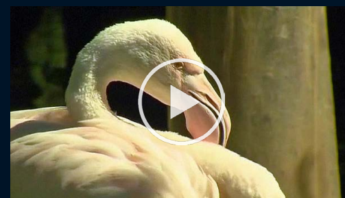
Världens äldsta flamingo död