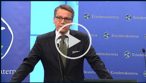
KD vill ändra flyktingpolitiken