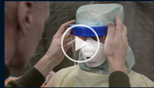
De övar inför ebolainsats