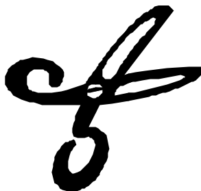
Potreban finasijski rez u UNHCR-u

- Mi smo pocceli sa mjerama sstednje joss 1998. godine, a odmah godinu dana kasnije eksplodirala je situacija na Kosovu. To nas je "skupo" kosstalo jer UNHCR- je dobio veli-