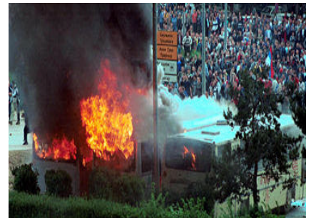
Miris palezi ponovo se siri..

pola sata sam iz grada, svi "nasi" autobusi parkirani na parkingu podno Kasetela su zapaljeni, prije toga je "pusteno" prase na dzamisce i nekoliko momaka Bosnjaka skoro lincovano usprkos jakim policijskim snagama, SFOR-u, "udobno" lociran oko hotela "Bosna"!!!! Sve u svemu, veoma mucna situacija.. Prilicno je neizvjesno sta ce sad biti sa svim tim "nasim" svijetom, kao i kompletnim razvojem situacije... Eto, ovo ti saljem jer ne znam koliko brzo imas informaciju sa lica mjesta, sto bi se reklo, mada sad nista vise i nije vazno, ko sto rekoh u "subjectu" za mene je ona srusena po drugi put,... Banja Luka/Stokholm- Medju onima koji su se zadesili u Banja Luci bio je i svedski ambasador u BiH. - Nisam se osjećao ugroženim, kazao je nakon dramaticnih događaja za svedske medije ambasador Eliason, ali bilo je ocigledno da su mnogi Bosanci bili smrtno preplasceni. Eliasson se nalazio zajedno sa izaslanikom UN Zak Klajnom i nekolicinom ostalih ambasadora zatocen u zbradi medzlisia. - Kamenje je letjelo, prozorska stakla su razbijana i Srbi su pjevali nacionalisticke pjesme, opsiuje sitaciju za novinsku agenciju TT, koja dogadjaj opisuje: "Ceremoji su omeli bosanski srpski nacionalisti. Vise hiljada ljudi ucestvovalo je u tome, gadjajuci kamenjem i razbijajuci stakala. Vozila su paljena kao i autobusi kojima su dove-