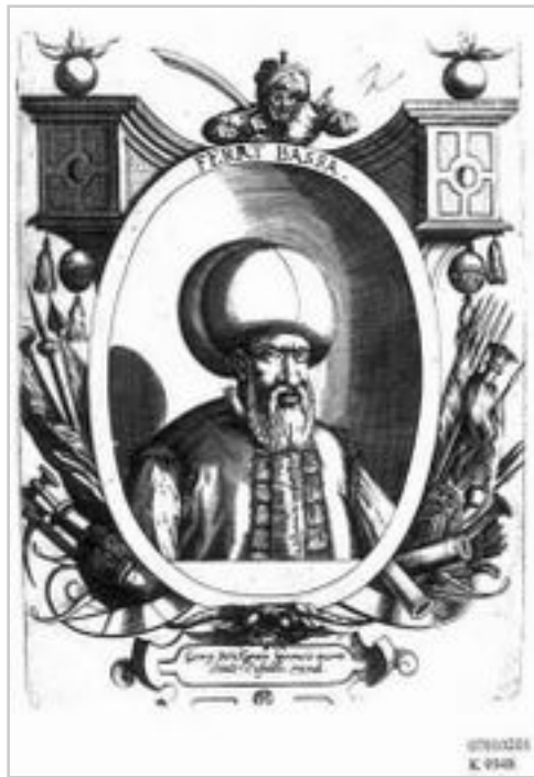
Portret Ferhat-paše Sokolovica iz 1612. od Dominicusa Custosa

Osmanska vojska pod vodstvom Gazi Husrev-bega osvaja Banja Luku 1521. godine. Grad se time počeo razvijati već 1528. godine sa izgradnjom naselja Gornji Šeher . Banja Luka je kao grad vrlo brzo rasla i 1533. godine postaje glavni grad Bosanskog sandžaka (kasnije Bosanskog pašaluka ). Glavni graditelj Banje Luke je bez sumnje bio Ferhat-paša Sokolović , bliski rođak Mehmed-paše Sokolovica , jednog od najznacajnijih bosanskih velikana i jednog od najutjecajnijih ljudi tog doba u cijelom Osmanskom carstvu. Najvažniji doprinos Ferhat-paše Banjoj Luci bila je džamija Ferhadija , sa kojom je također utemeljena prvobitna vodovodna infrastruktura Banje Luke koja je služila njenom bržem urbanom razvitku. Novac za konstrukciju džamije je dobijen od kapare za zarobljenog austrijskog komandira, a iznosio je 30.000 dukata. Drugi važan objekat izgrađen nedugo nakon Ferhadije je Arnaudija džamija , napravljena na drugom kraju ulice u odnosu na Ferhadiju. Između ove dvije monumentalne gradske džamije gradska uprava je forsirala trgovinu i podizanje zanatskih ducana, koji su u to vrijeme stimulisali ekonomski razvoj grada. Iz ovog vremena potice i gradnja Banjalucke sahat-kule , koja je izgrađena nedaleko od Ferhadije, čime se ovaj dio grada nedaleko od Kastela zaokružuje kao posebna historijsko-urbana cjelina, danas poznata pod imenom Stari Grad Banje Luke.