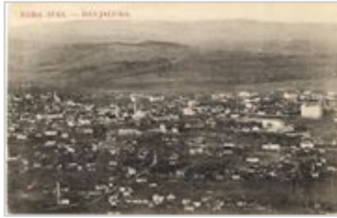
Banja Luka početkom 20. stoljeca

Nakon Prvog svjetskog rata Banja Luka je postala centar Vrbaske banovine , te je nastavila svoj razvoj. Tokom ovog vremena izgrađeni su Banski dvor, općina, gradski muzej i učiteljska škola. Za vrijeme Drugog svjetskog rata grad su okupirali fašisti Nezavisne Države Hrvatske . Za vrijeme vladavine NDH ugledne jevrejske porodice su bile deportirane u koncentracione logore u Hrvatskoj. U isto vrijeme grad postaje jedan od glavnih centara partizanskog otpora, da bi 22. aprila 1945. godine grad bio u potpunosti i oslobođen.