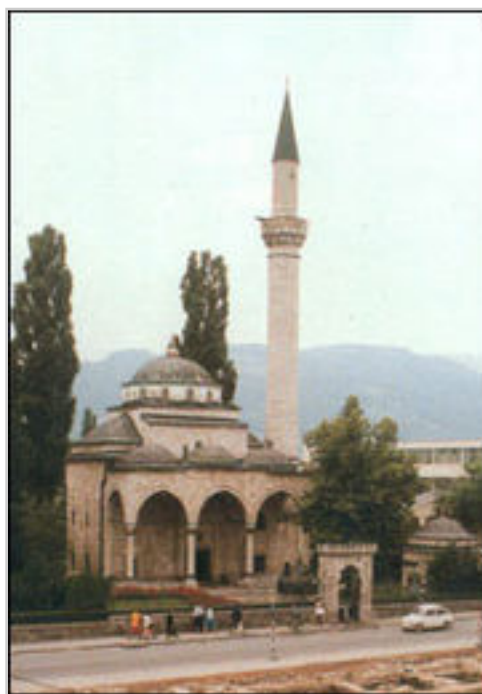
Ferhat-pašina džamija ili Ferhadija. Izgradjena 1579. godine, uništena 1993. godine.

Zahvaljujuci svojoj dugoj i vrijednoj historiji grad Banja Luka ima veoma bogato i raznoliko kulturno naslijedje. U gradu se nalazi nekoliko muzeja, od kojih treba izdvojiti Muzej Bosanske krajine , Etnografski muzej (osnovan 1930. godine), te Muzej savremene umjetnosti