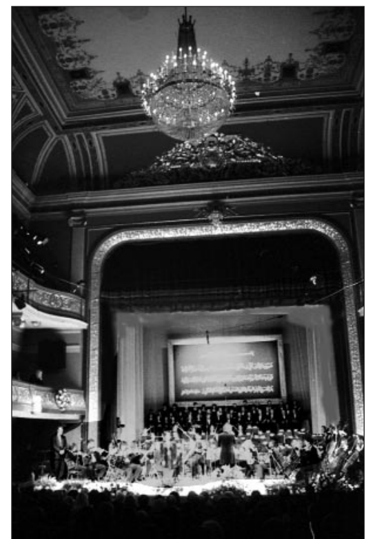
Sinoćnja atmosfera u Narodnom pozorištu